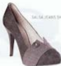
SALSA JEANS SHOES